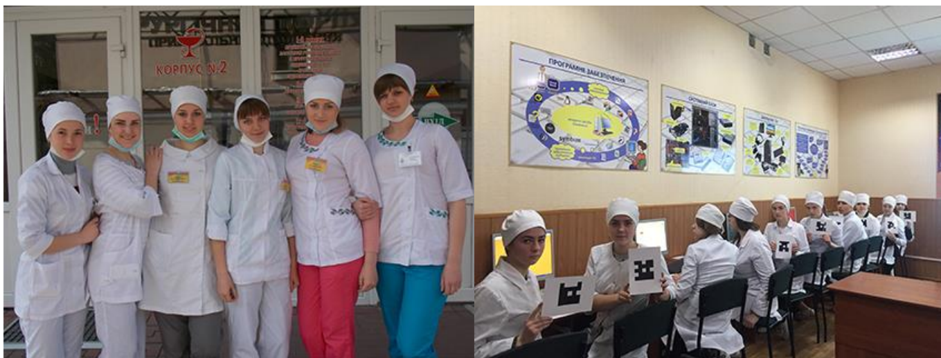
Студенти на заняттях у навчальному корпусі

Навчальну, виробничу і переддипломну практику студенти коледжу проходять на базах 33 лікувально-профілактичних закладів міста та області. Практично на базі усіх лікувально-профілактичних закладів міста організовані навчальні комплекси, що мають кабінети доклінічної практики, аудиторії, санітарно-гігієнічні та лаборантські кімнати.