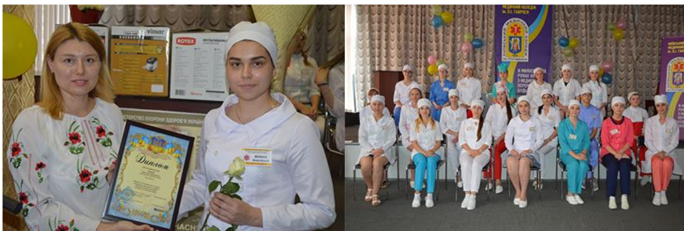
Переможниці конкурсу "Ескулап"

Свідченням якісної фахової підготовки майбутніх медсестер є постійна участь у Всеукраїнському конкурсі фахової майстерності «Ескулап», на якому студенти нашого відділення ставали дипломантами та лауреатами конкурсу.