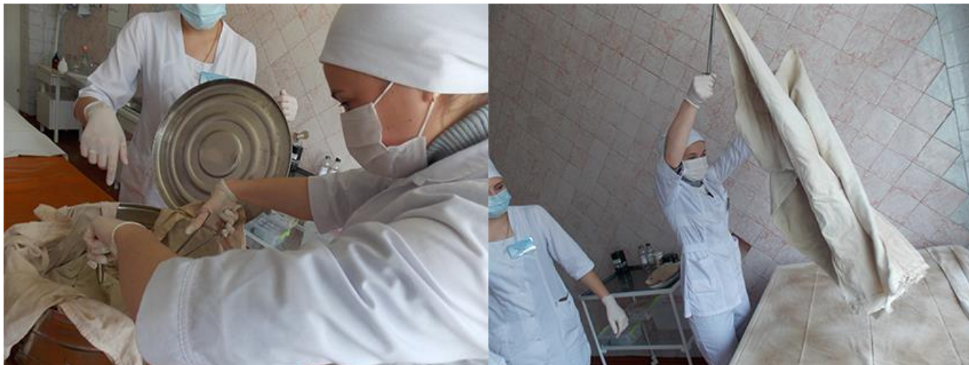
Студенти на практичному занятті у лікарні

Медична сестра може займати первинні посади у лікувально-профілактичних, санітарно-епідеміологічних закладах, безпосередньо може брати участь у проведенні комплексу екстрених медичних заходів на догоспітальному етапі, в обстеженні пацієнта, підготовці його до оперативного втручання, працювати в операційній, медичним статистиком, у косметологічних кабінетах, доглядати за хворими у відділеннях реанімації, інтенсивної терапії, у курортних установах.