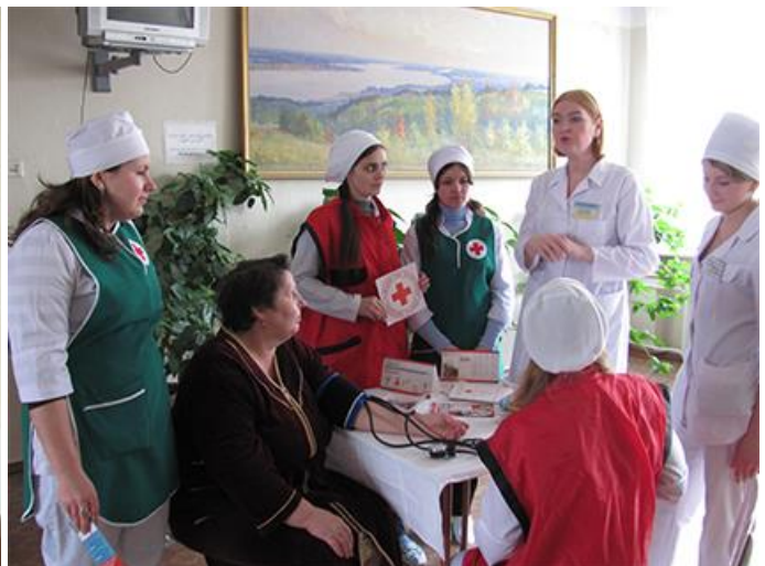
Студенти на заняттях із сестринської справи